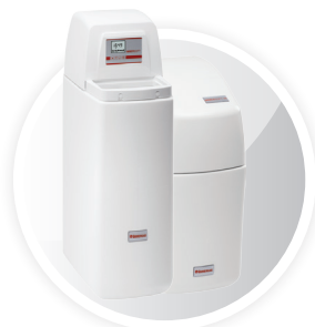
Zmiękczacz wody Immersoft