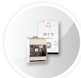
Moduł Wi-Fi Dominus