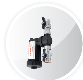
Filtr Magnetyczny Clean Water