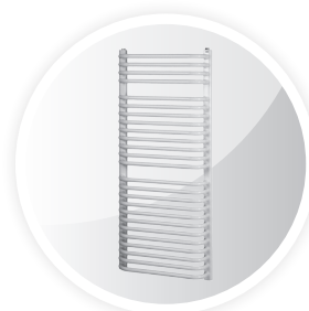
Grzejnik łazienkowy SOL

Promocja obowiązuje od 01.06.2017 do wyczerpania elementów objętych promocją.